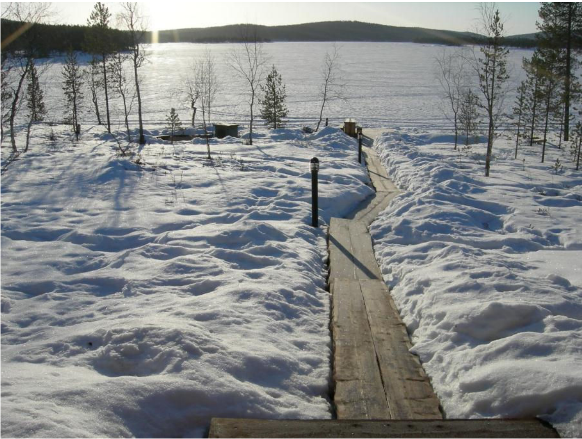
Mökiltä rantaan päin – laiturille ja nuotiopaikalle. Pitkokset auki kevättalvella. Huhtikuu 2012.