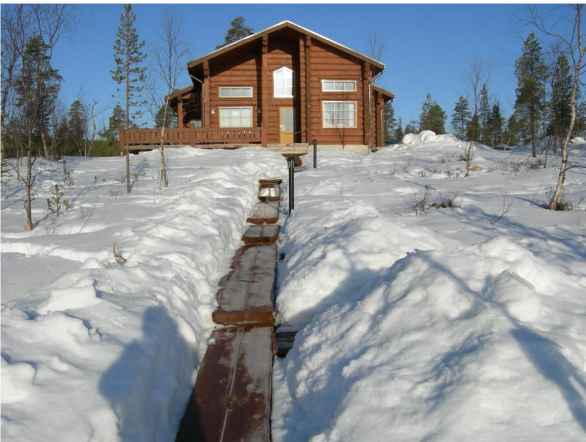
Rannasta mökille päin.