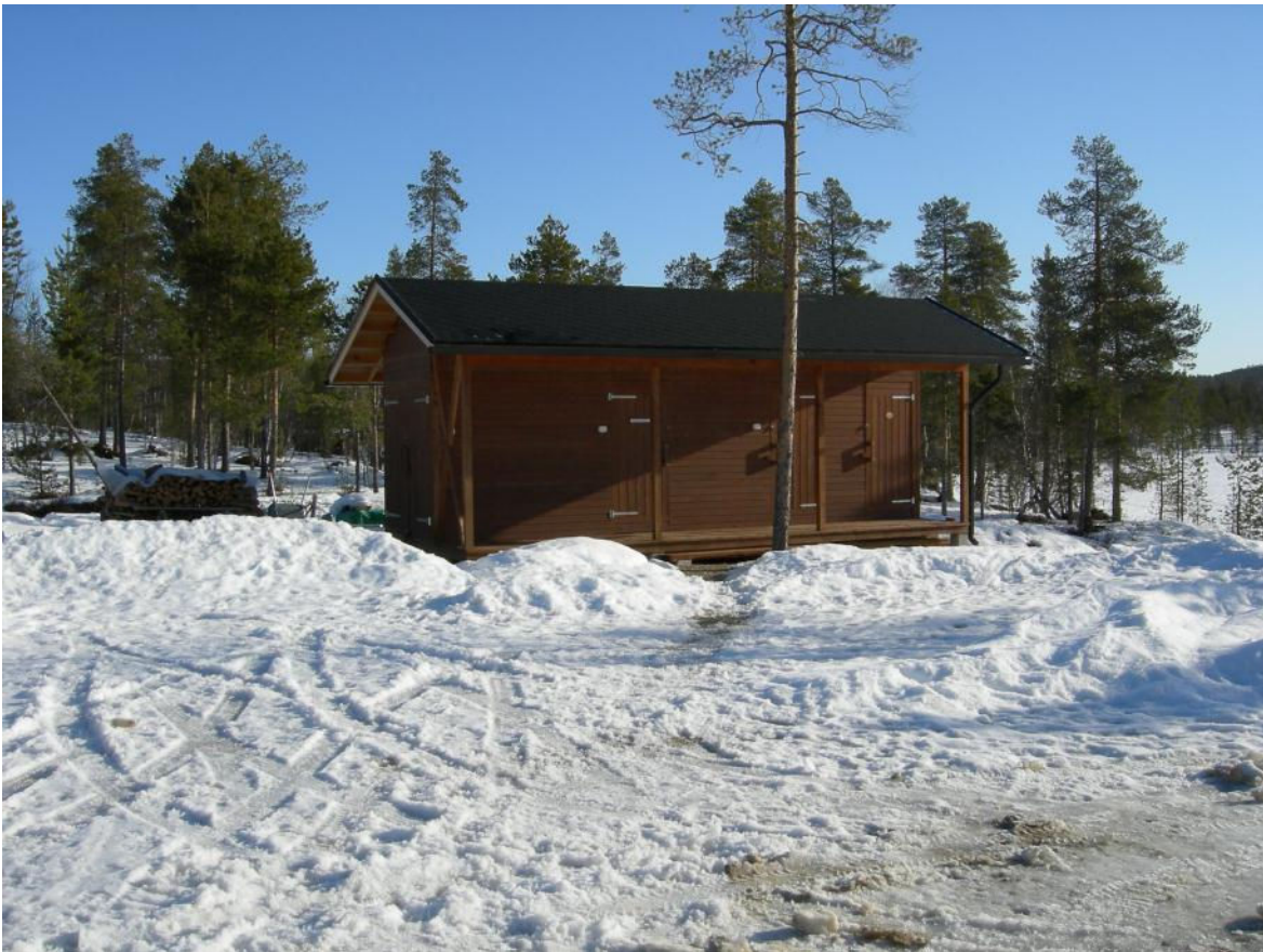
Ulkorakennus (varasto & liiteri ja kompostoiva käymälä) kevättalvella